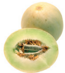
melón dulce honeydew

Los precios siguen subiendo; los problemas de calidad, específicamente el Virus de la Mancha Necrótica de Impatiens (INSV) y la Sclerotinia, están reduciendo los suministros. MFC Lechuga Orejona Verde está disponible esporádicamente; Markon Best Available (MBA) se sustituirá cuando se necesite.