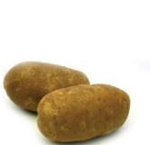
pommes de terre

Les prix sont bas. Les grosses pommes de terre sont limitées en Idaho; les stocks de calibres 40 à 80 sont plus abondants. Les petits calibres et celles de grade n° 2 sont abondants. Les pommes de terre Burbank et Norkotah MFC d'Idaho sont disponibles.