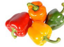
pimientos verdes y rojos

Espere precios altos y rendimiento bajo durante junio. La principal cosecha de los aguacates de México está disminuyendo; los agricultores están retrasando las cosechas para prolongar la temporada hasta que comience la cosecha de la variedad Loca en julio. Se enviarán existencias desde California y Perú para ayudar a cubrir los pedidos. RSS Aguacates en Trozos, Mitades, Guacamole Pico de Gallo, Autentico Guacamole con Trocitos, y Pulpa Pura están disponibles.