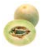
melón dulce honeydew

Los precios están bajos; los suministros abundan en el desierto de Arizona y California. MFC Lechuga Orejona Verde está disponible.