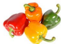
pimientos verdes y rojos

Los precios están estables. La temporada del otoño de California está concluyendo. Los suministros mexicanos y peruanos están satisfaciendo la demanda. La calidad está muy buena. RSS Aguacate en Trozos, Mitades, Guacamole Pico de Gallo, y Pulpa Pura están disponibles.